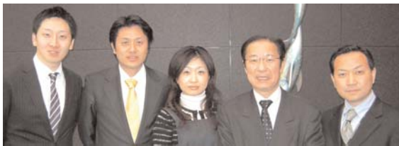
Sanyo Trading Team